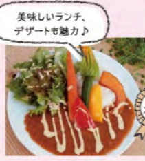
美味しいランチ、デザートも魅力♪